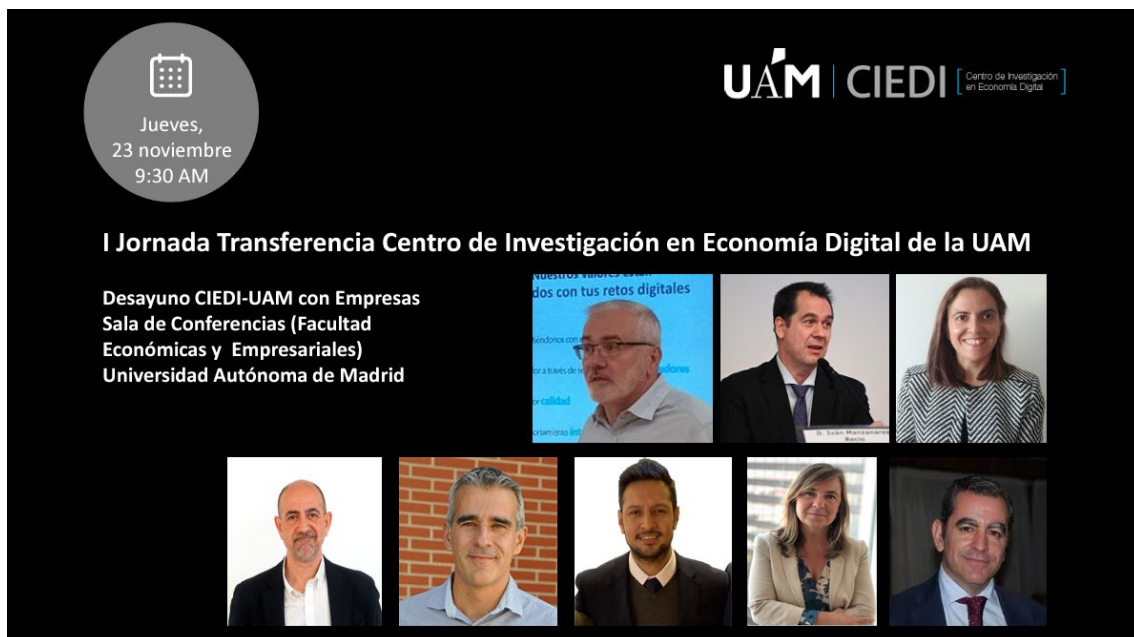
Figura 3. I Jornada Transferencia Centro de Investigación en Economía Digital

El programa de la jornada se puede consultar en la figura 3.