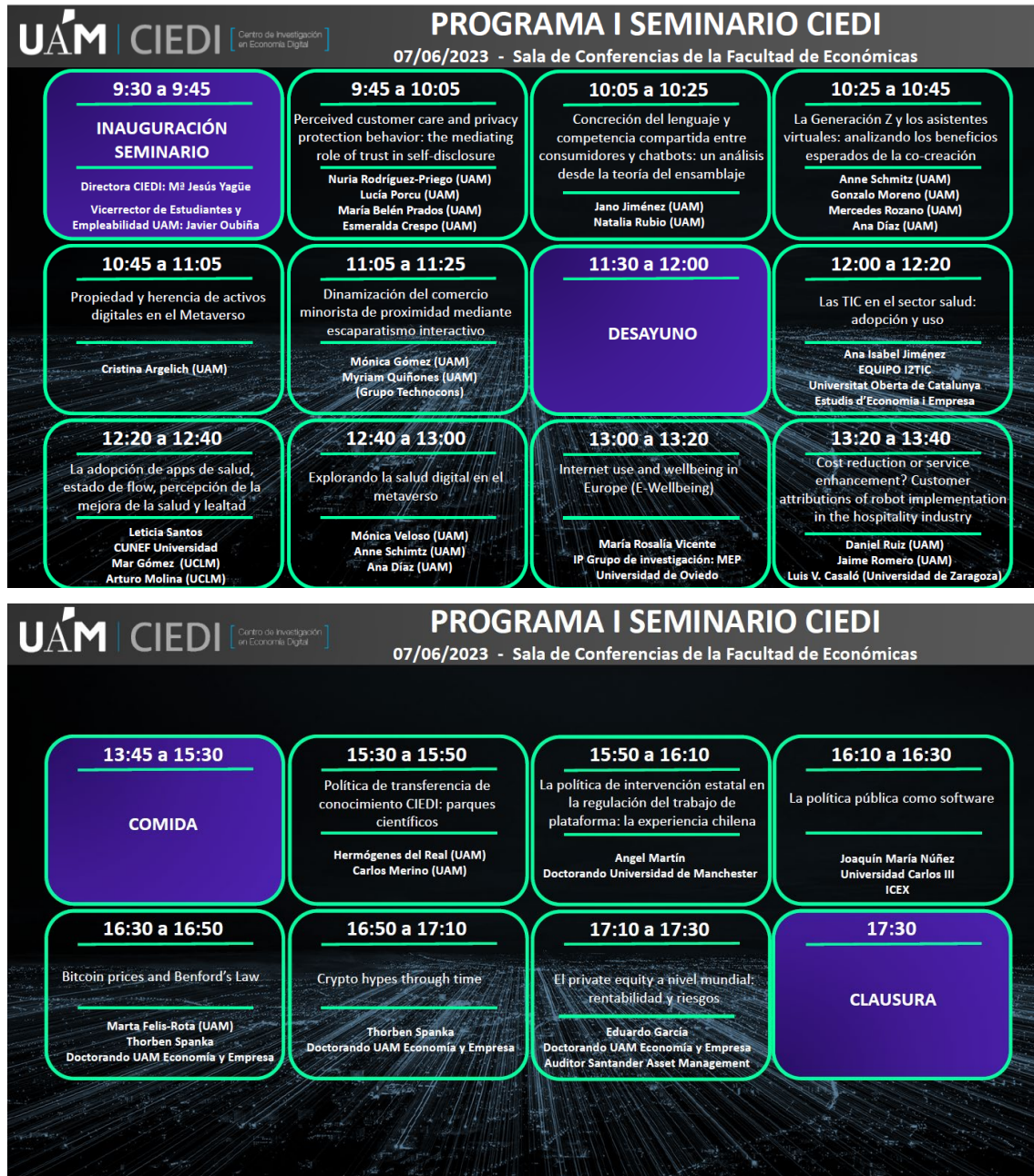
Figura 1: I Seminario CIEDI

El segundo seminario (figura 2), con el título: “Changing Consumer Behaviour in an Era of Digital Disruption” tuvo como ponente invitada a Bárbara E. Kahn, profesora de marketing en la Wharton School de la Universidad de Pensilvania. Fue directora de