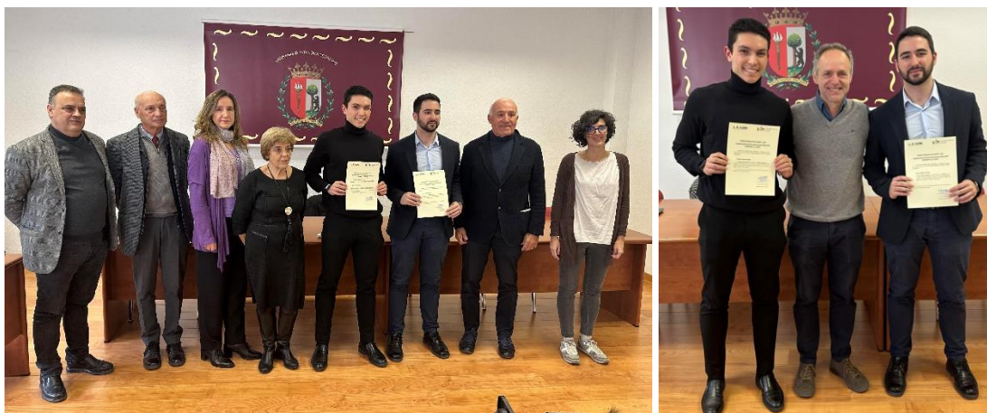
Entrega de premios TFG 3ª edición 2023 Instituto L.R.Klein-UAM (a la izquierda premiados y miembros del tribunal, a la derecha premiados con tutor)